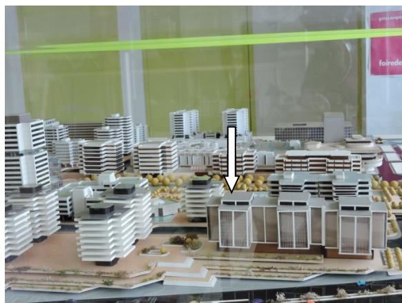
Maquette Bordeaux Métropole